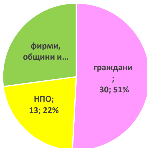
Фиг. 1 Постъпили заявления по ЗДОИ в РИОСВ-Пловдив през 2025 г. по тип на заявителя

За отчетния период най-много заявления са получени по електронен път (чрез електронна поща електронен обмен) – 34 на брой (58%). Освен тях 21 (36%) от заявленията са входираны на място в деловодството на РИОСВ – Пловдив, 1 заявление е